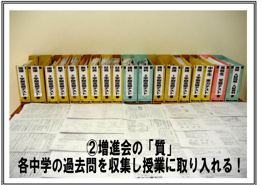
②増進会の「質」 各中学の過去問を収集し授業に取り入れる！

後一步伸ばしたいキミ！大幅に成績を伸ばしたいキミ！ 成績向上例を見て、増進会で一緒に頑張りよう！！