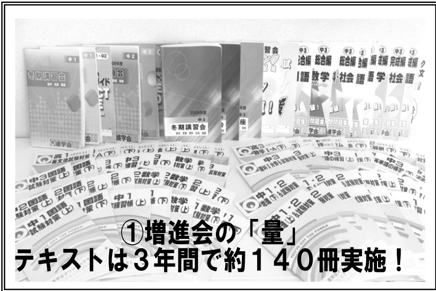
①増進会の「量」 テキストは3年間で約140冊実施！