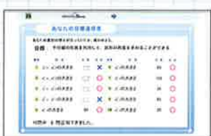
学習の状況を記録。到達度が確認できる。