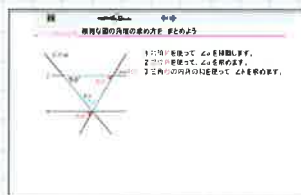
自分の弱点(間違い)に沿った類題で演習。