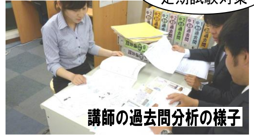
講師の過去問分析の様子