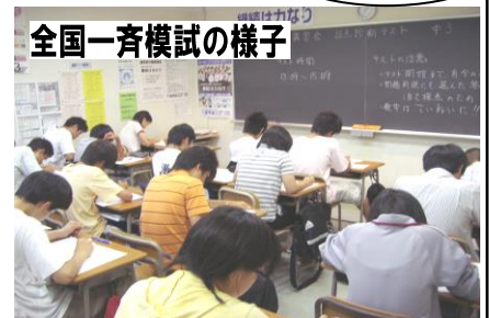
全国一斉模試の様子

試験範囲は今までに学習した全範囲が出るので、定期試験だけではわからない『真の学力』がわかります。さらに、テスト終了後はできなかった問題の解き直しをしてもらいます。増進会は、「弱点」に焦点を当て、徹底的に反復させるシステムを持っています。