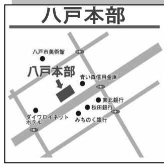
八日町9番地ダイヤビル2